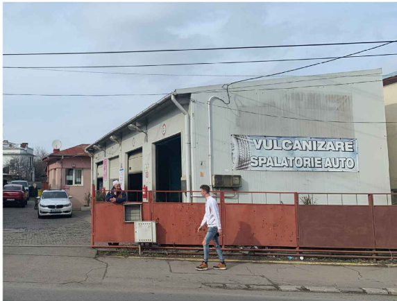
Cladire existenta pe sit