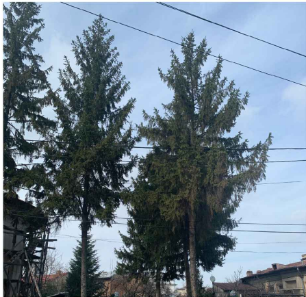
Brazi inalti in jurul Bisericii