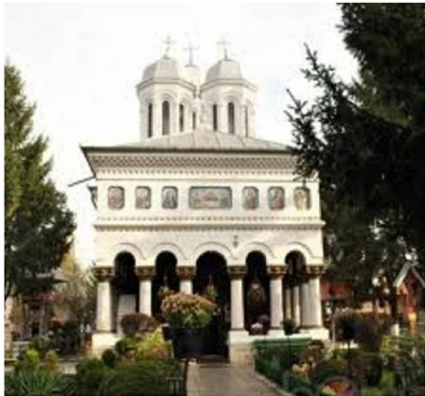
Biserica Maica Precista