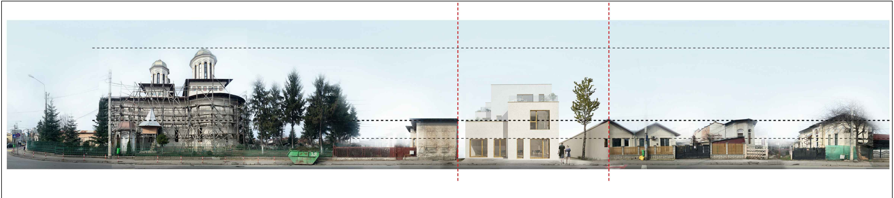
INSERTIE VOLUMETRICA IN DESFASURATA STRADALA